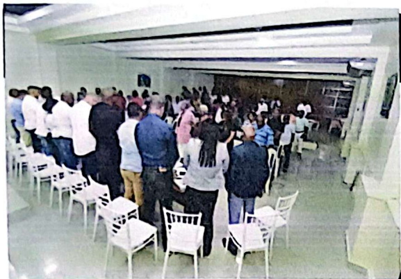
Imagen 01. Inicio del Cabildo Abierto con una oración