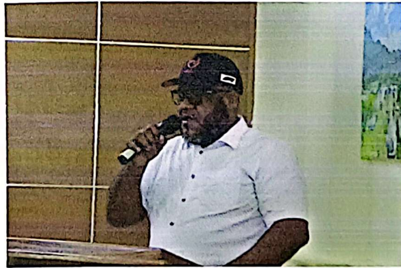
Imagen 14. "Acto seguido, los Regidores presentes hicieron uso de la palabra para manifestar su compromiso unánime de elevar a sesión de Concejo lo aquí pactado, a los fines de emitir la Resolución Municipal que apruebe formalmente el listado de obras, los montos de inversión y la conformación del Comité de Seguimiento y Control, dando estricto cumplimiento al mandato de la asamblea y garantizando