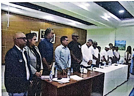
Imagen 02. Parte de las autoridades presentes en el momento de la lectura bíblica.