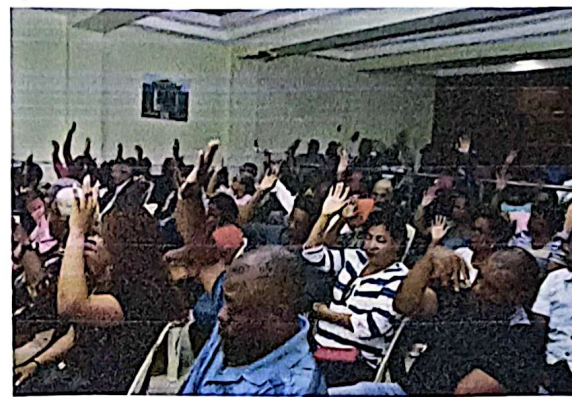
Imagen 08. Proceso de votación y consenso democrático: Vista general de los delegados comunitarios ejerciendo su derecho al voto mediante el levantamiento de manos, para la aprobación de los puntos tratados en la agenda