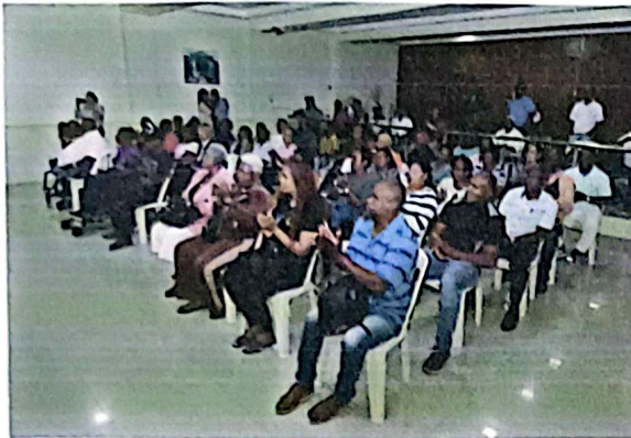
Imagen 05. Parte de los Delegados y Delegadas presentes en la Asamblea