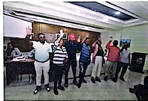
Imagenes 11 y 12. Constitución del Comité de Seguimiento y Control del Presupuesto Participativo Municipal 2026, como órgano de vigilancia, quienes asumen la responsabilidad de fiscalizar la correcta inversión de los fondos del PPM 2026.