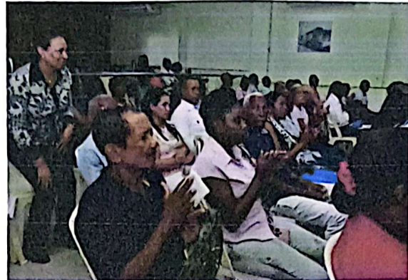
Imagen 06. Momento al elegir a la Secretaria de la Asamblea