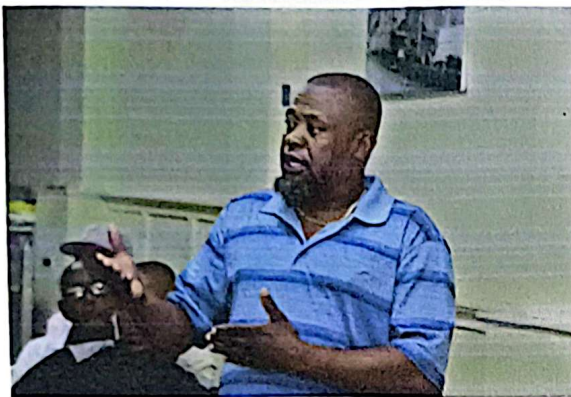
Imagen 07. Intervención de representante comunitario en el uso de la palabra: Momento en el que un delegado expone sus consideraciones y propuestas ante el pleno, garantizando el derecho a la participación